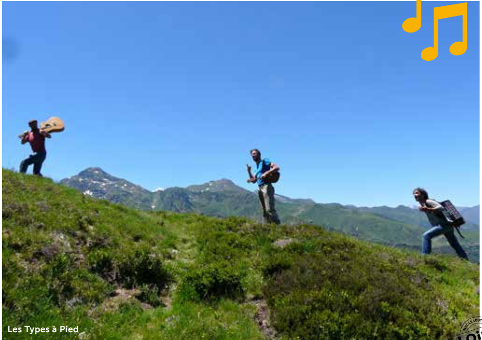
Les Types à Pied