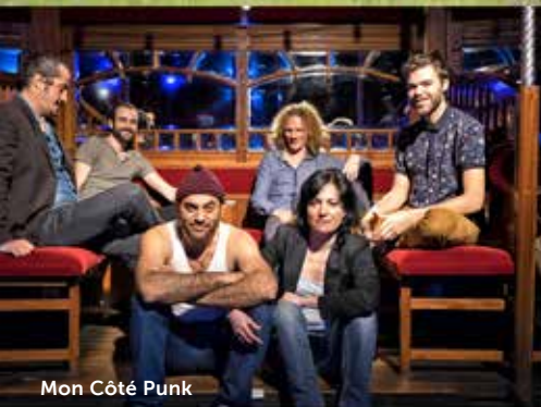
Mon Côté Punk