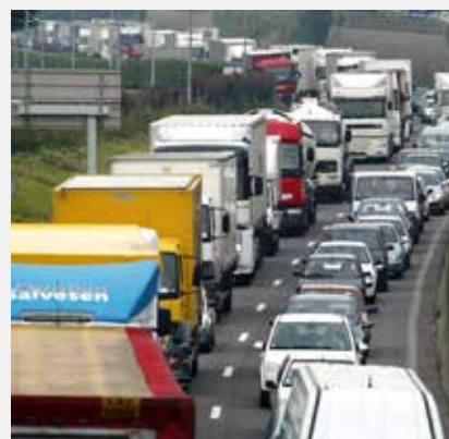
L'A47, une liaison Saint-Étienne/Lyon saturée et accidentogène.

« Le dossier de l'A45 était techniquement, juridiquement et financièrement bouclé depuis avril 2017. Seule manquait la signature du gouvernement pour que le chantier démarre (...) Aujourd'hui, on apprend que l'État mobiliserait finalement des crédits pour des aménagements existants, contredisant l'argument régulièrement avancé par le gouvernement arguant de difficultés à financer les nouveaux projets d'infrastructures. » Selon la ministre des Transports, l'État investira les 400 millions d'euros prévus pour l'A45 dans l'amélioration de la relation routière et ferroviaire entre Saint-Étienne et Lyon. ■