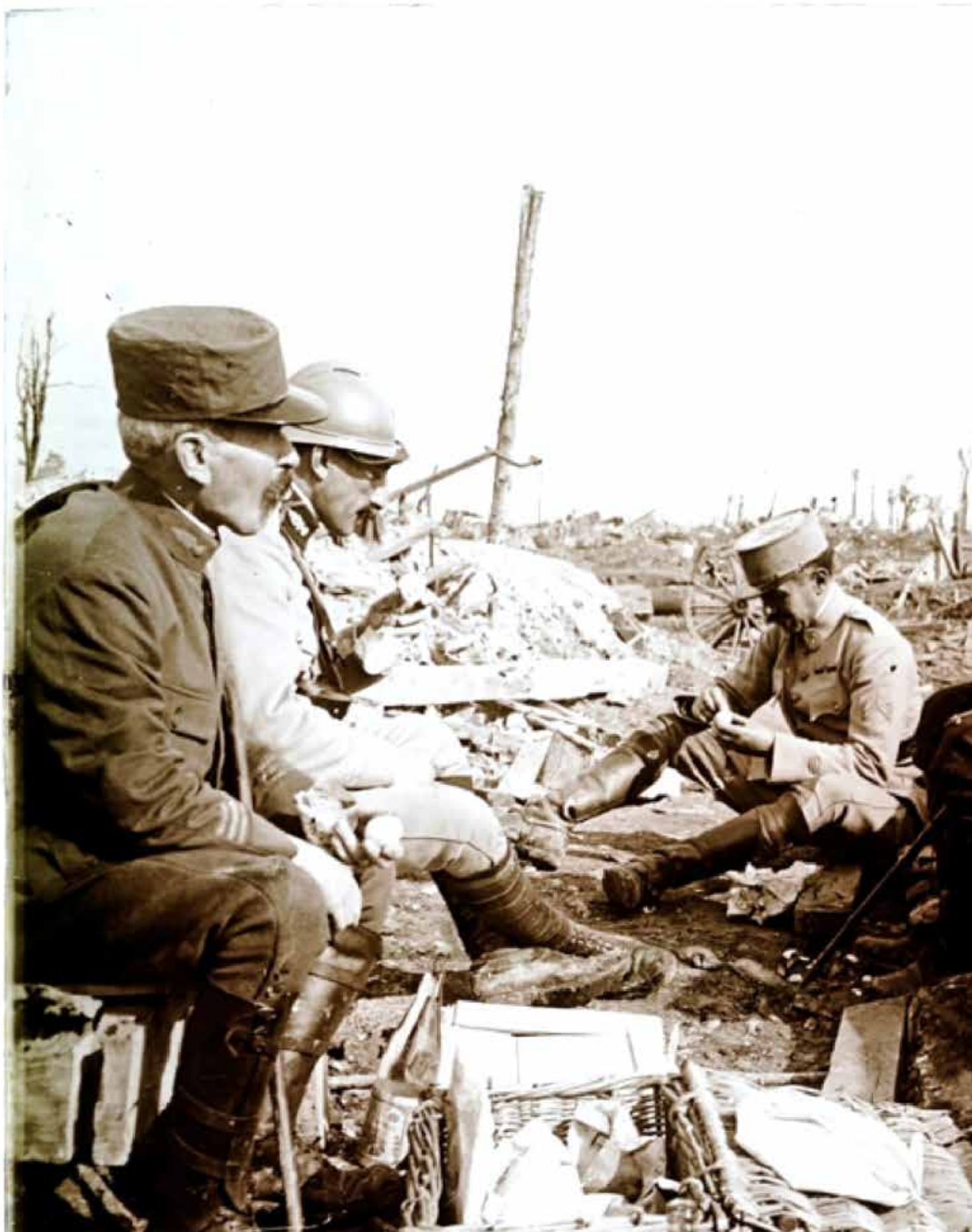
La guerre des tranchées. Georges Clemenceau sur le front avec son fils, à Maurepas (Somme), en octobre 1916. Photographie sur plaque de verre stéréoscopique, issue des archives des familles Goutenoire et Ovize, numérisée par Les Archives départementales de la Loire dans le cadre de l'opération nationale « Grande Collecte » liée au centenaire de la guerre 1914-1918.