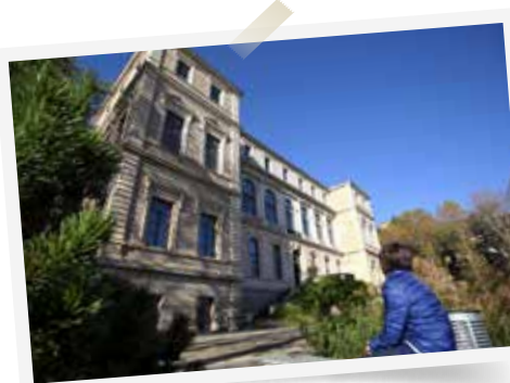
Le palais des arts devient musée d'Art et d'Industrie en 1889

La fabrication d'armes à Saint-Étienne remonte au Moyen Âge. C'est François 1 er qui, à la Renaissance, décide d'y fonder les prémices d'une Manufacture royale d'armes. Installée place Chavanelle, celle-ci sera ensuite transférée dans l'actuel quartier créatif stéphanois pour devenir la Manufacture impériale, puis nationale. « Ce rôle d'arsenal s'est renforcé avec l'exploitation industrielle de la houille. » La ville a aussi ouvert la marche à la gravure sur arme dès le XVIII e siècle. Épées, bombardes, armures, mousquets et arquebuses... Ici, les enfants se rêvent preux chevaliers et on entendrait presque la ville bruiser au son de l'artillerie. On avance ensuite dans les siècles avec les armes militaires et les fusils de chasse ouvragés. Mais les armes ne sont pas les seuls trésors du musée. Elles côtoient également le ruban, l'accessoire de mode indiscutable du XVIII e siècle. D'ailleurs, savez-vous que les premiers enrubannés étaient les hommes ? Prenant son indépendance vis-à-vis de la soierie lyonnaise, Saint-Étienne connaît son âge d'or au XIX e siècle sous le règne de grands fabricants comme Staron ou Neyret, et devient la capitale mondiale du ruban. La collection du musée est d'ailleurs la plus importante du globe. Chaque pièce vous transporte dans le monde des froufrous et de la mode... On suit alors l'évolution de leur fabrication, des métiers à tisser d'autrefois, dont le métier à mécanique Jacquard, jusqu'à l'ère industrielle et aux nouveaux textiles.