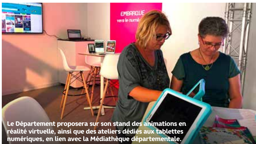
Le Département proposera sur son stand des animations en réalité virtuelle, ainsi que des ateliers dédiés aux tablettes numériques, en lien avec la Médiathèque départementale.

+ D'INFOS ..... Le 29 novembre à partir de 9 h Centre de congrès de Saint-Étienne Entrée libre http://portes-ouvertes-securite-sociale.fr